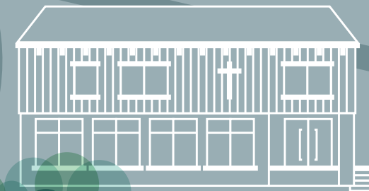
HAUS DER VORSEHUNG Pflegeheim