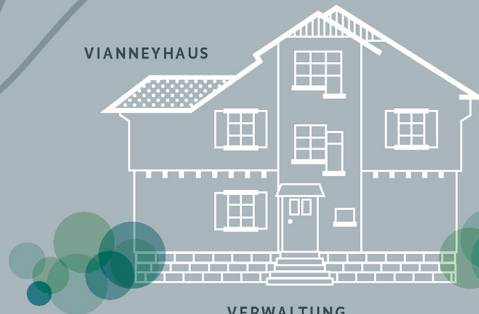
VERWALTUNG Ambulant Betreutes Wohnen